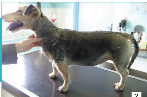
2. Traitement d'une coxalgie par des points locaux et locorégionaux à la suite d'une séance d'ostéopathie.

Comment intégrer l'acupuncture à sa pratique quotidienne ?