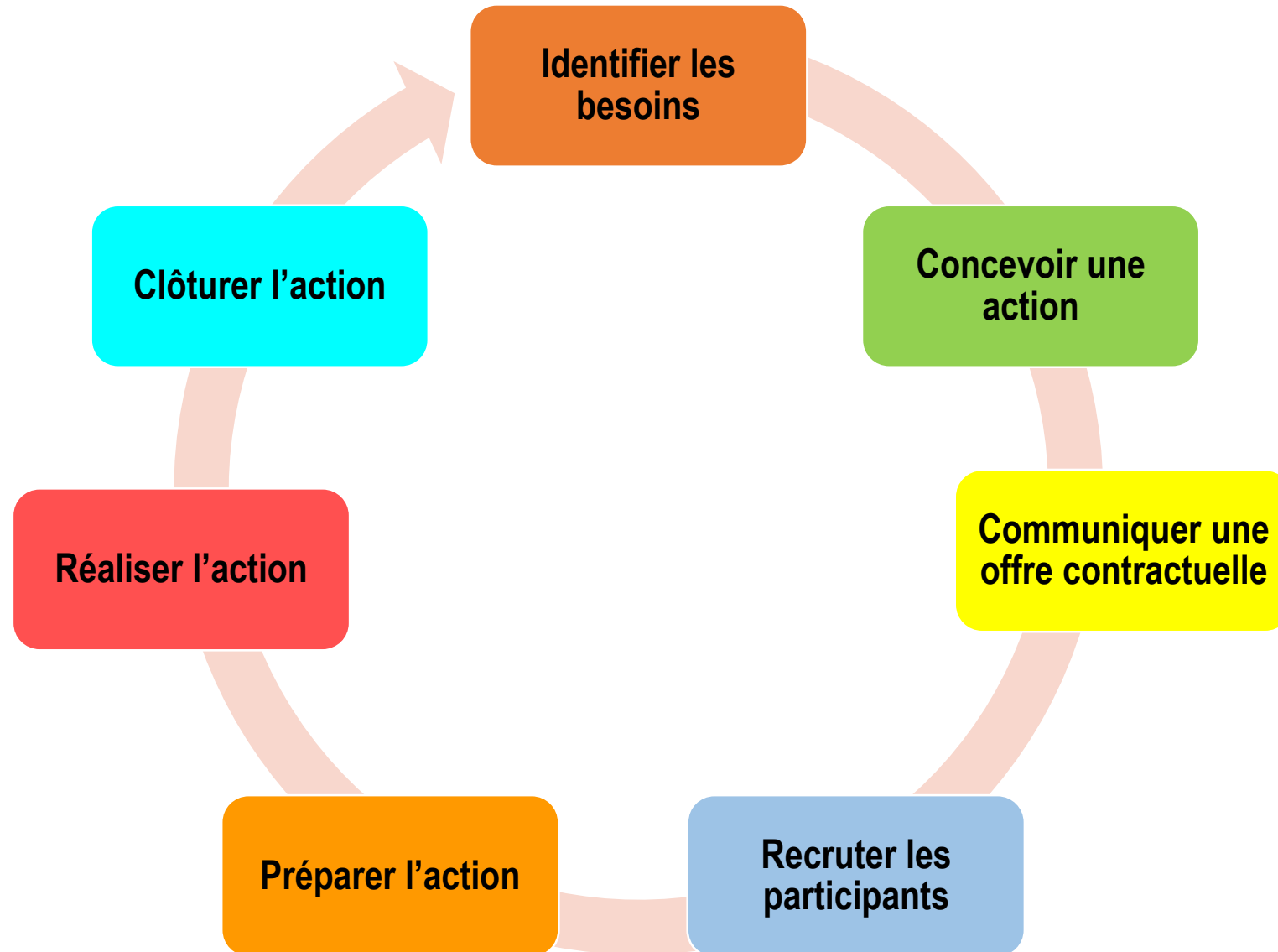
Schéma synthétique d'une action de formation